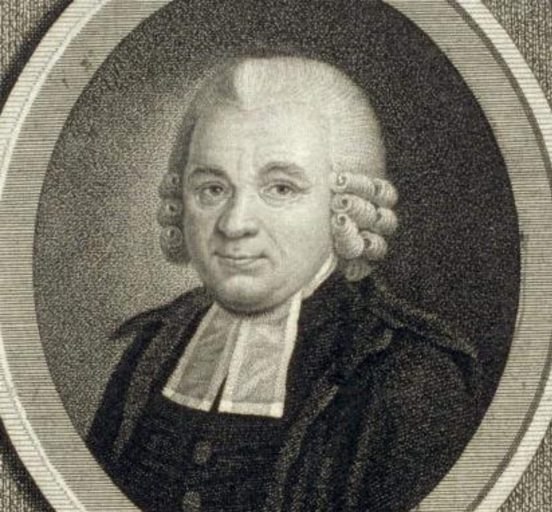
2. A. V. Hüpelis (1737–1819) – manuskripta tulkotājs igauņu valodā