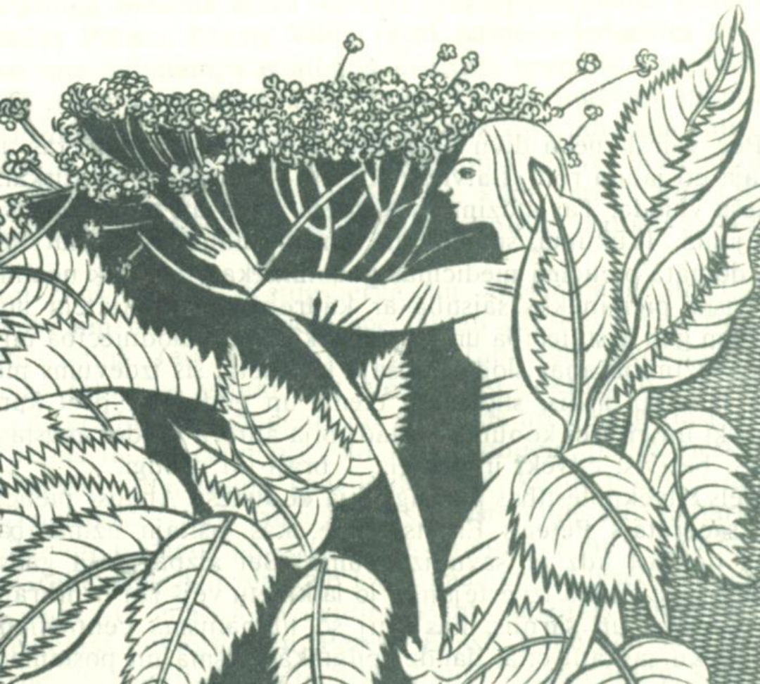
8. A. Sprūdža ilustrācija "Latviešu Ārstes" faksimilizdevumam (1991)