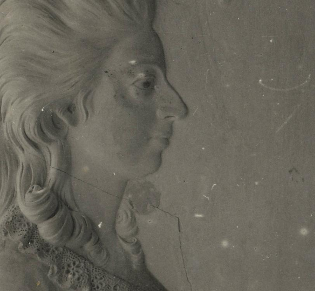
4. Peltsamā (Oberpālenes) pils dekors